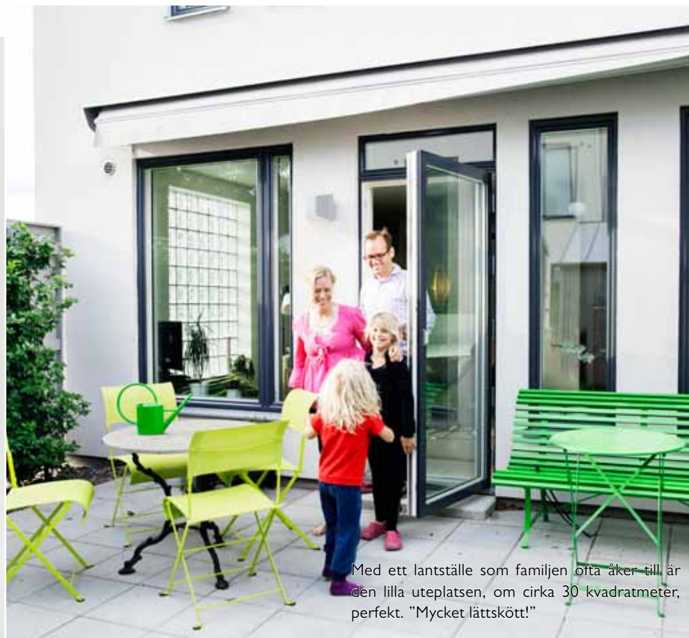
Med ett lantställe som familjen ofta åker till är den lilla uteplatsen, om cirka 30 kvadratmeter, perfekt. "Mycket lättskött!"