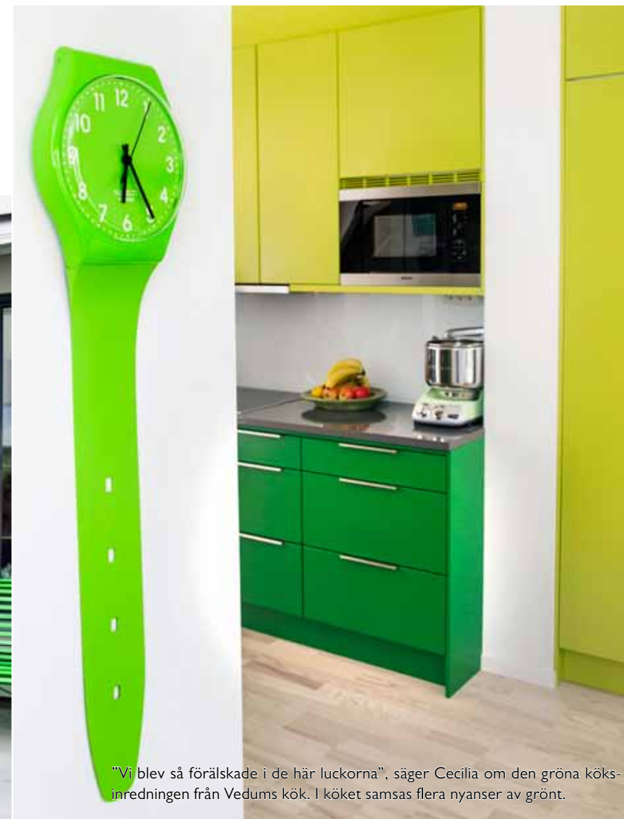
"Vi blev så förälskade i de här luckorna", säger Cecilia om den gröna köksinredningen från Vedums kök. I köket samsas flera nyanser av grönt.