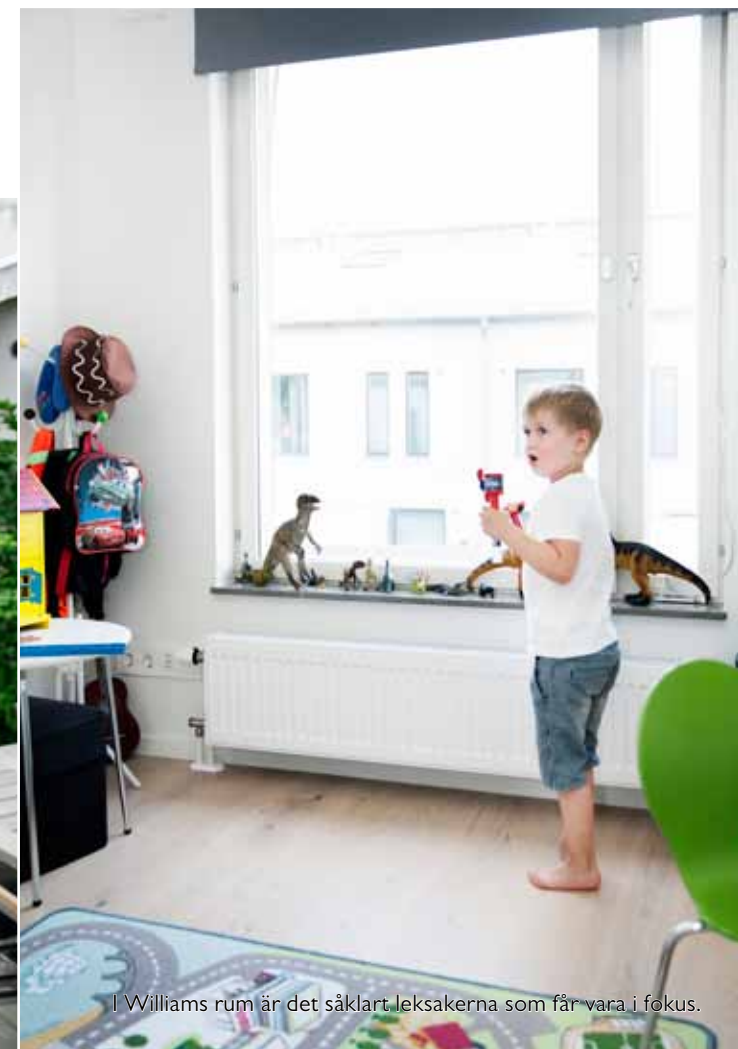
I Williams rum är det såklart leksakerna som får vara i fokus.