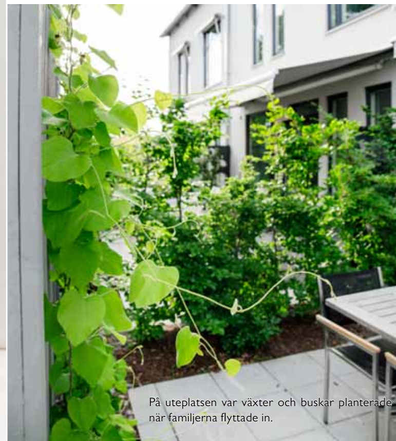
På uteplatsen var växter och buskar planterade när familjerna flyttade in.